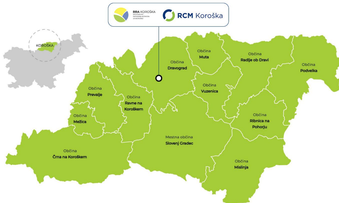
Slika 1: Karta regije z razdelitvijo na 12 občin ter lokacijo sedeža RRA Koroška in RCM Koroška