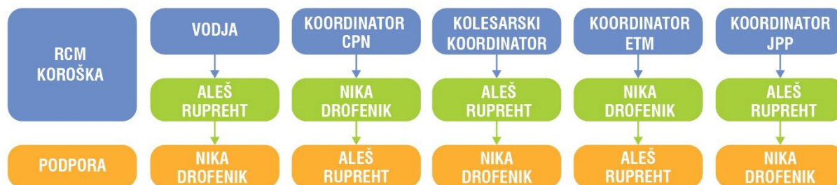
Shema 2: Organizacijska shema – kadrovska razdelitev